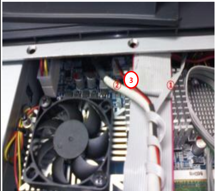
사진㉔ - 듀얼모니터 연결 케이블 본체 연결(②,③)