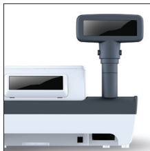
고객용 디스플레이 Rear or Pole 타입 2줄 16자