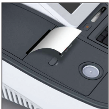
내장 프린터 2" 영수증 프린터 200mm/sec max