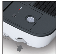
CF card socket