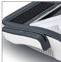
다기능 일체형 장치 마그네틱 카드 리더기 스마트 카드 리더기