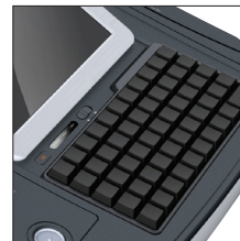
내장 키보드 미니키보드 PLU Key (option)